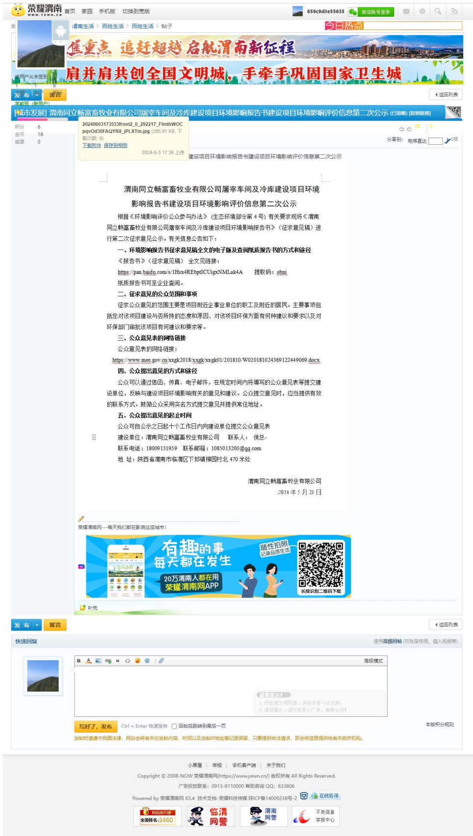
图2 环境影响评价第二次网站公示截图