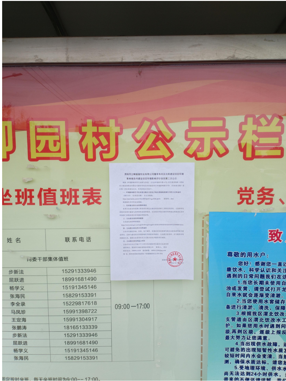
图 5 现场张贴公告照片